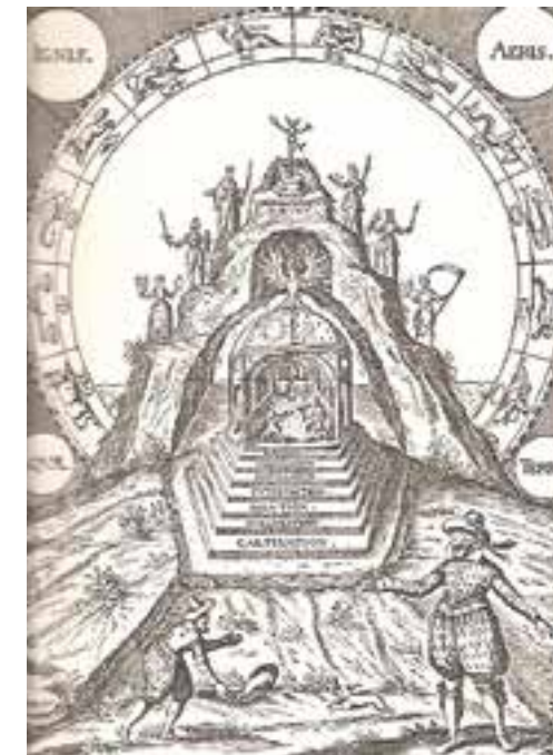
Abb.20 Stephan Michelspacher: Der Tempel der Weisen, 1654

Alchemistische Symbole hat vor allem Joseph Beuys in den Diskurs über die zeitgenössische Kunst eingebracht, am nachhaltigsten vielleicht in seinen Performances „Wie man dem toten Hasen die Bilder erklärt“ und „Aktion Goldhase“. Hasen bzw. Kaninchen sind in der Alchimie das Symbol der Wandlung.