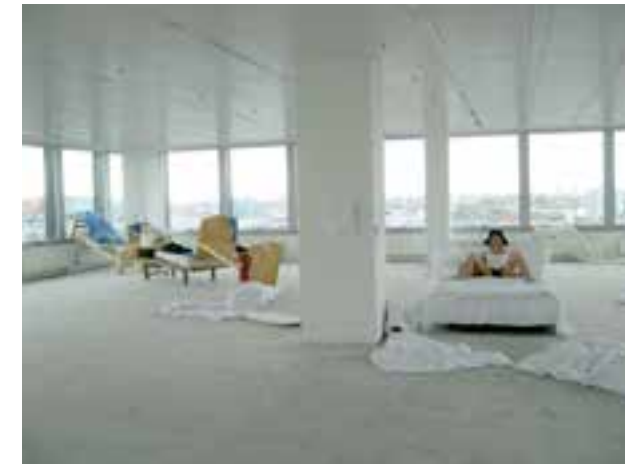
Abb.9 Yingmei Duan: Sleepless, 2007