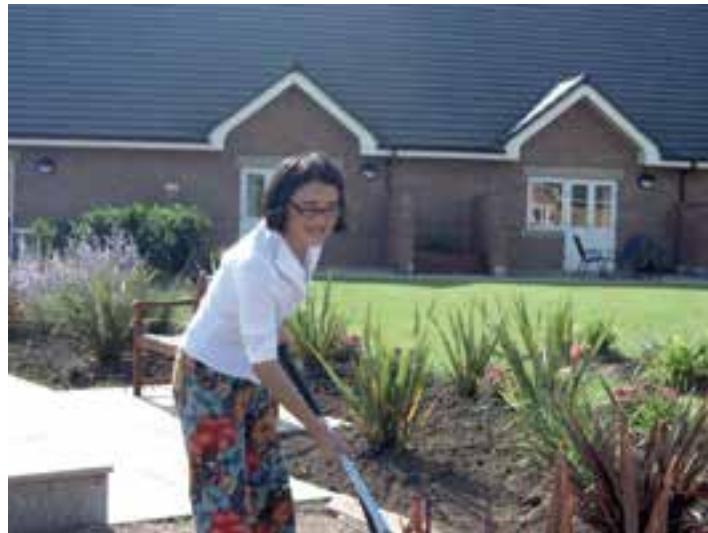
Bluebell Wood Children's Hospice, UK, 12.07.2010 – 04.09.2010 英国风铃草林儿童安养院, 2010年7月12日 – 2010年9月4日 Bluebell Wood Children's Hospice, UK, 12.07.2010 – 04.09.2010