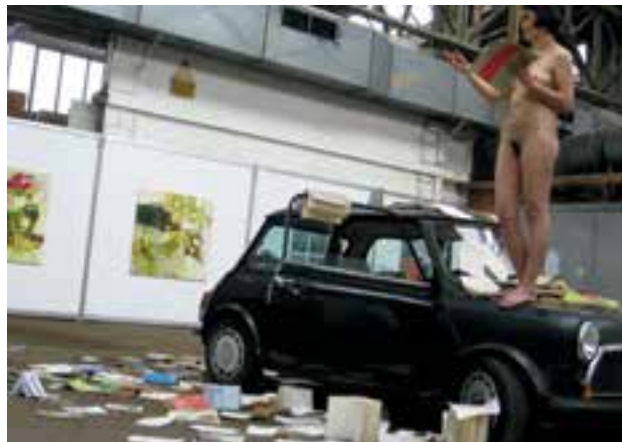
Abb.18 Yingmei Duan: Yingmei in Wonderland, 14. Tag, 2008