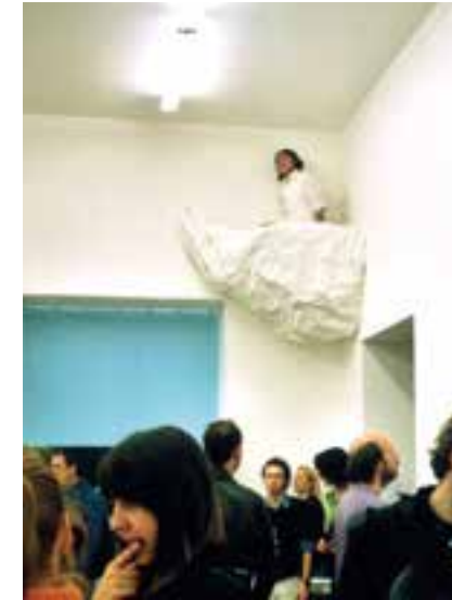
Abb.26 Yingmei Duan: Schwebende, 2005