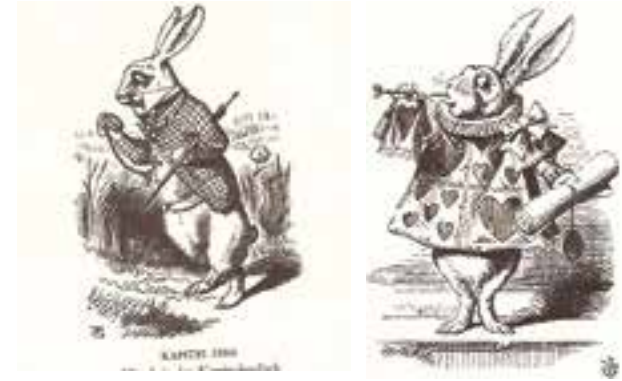
Abb.23 John Tenniel: Das weiße Kaninchen schaut auf die Uhr

Im Kunstverein Hannover dagegen schwebt Yingmei hoch über den Besuchern auf einer Wolke (Abb. 26). Die Verbindung von Immanenz und Transzendenz fasziniert sie auch auf einem Holzschnitt, auf dem der schlafende Hermes Trismegistos die Vision einer Himmelsleiter empfängt (Abb. 27). Die archetypische Bilderwelt der Hermetik ist mit der des Buddhismus verwandt, der Yingmei seit ihrer Kindheit vertraut ist. In der Wohnung ihrer Eltern steht von jeher eine Buddhastatue, der stets frisches Obst zu Füßen gelegt wird.