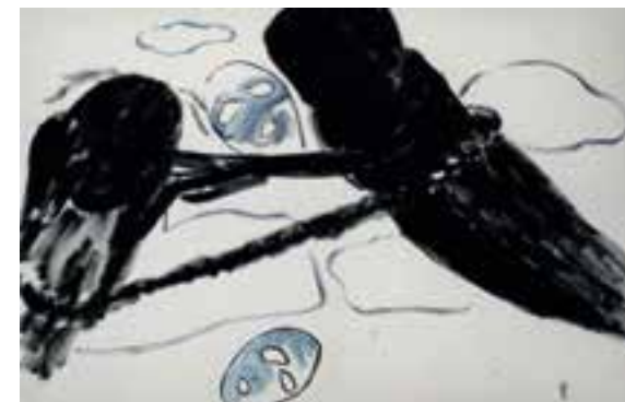
Dialog mit / Dialogue with “ONE YEAR PERFORMANCE” von Tehching Hsieh 和行为艺术家谢德庆一年的行为作品对话

Galerie auf Zeit Braunschweig, Deutschland, 21. 01.2007–25.02.2007 德国布伦瑞克Gallery auf Zeit画廊, 2007年1月21日 – 2007年2月25日 Gallery auf Zeit Braunschweig, Germany, 21.01.2007–25.02.2007