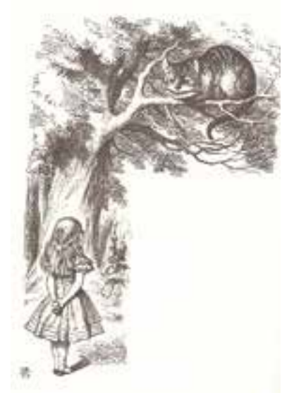
Abb.10 John Tenniel: Alice und die Grinsekatz