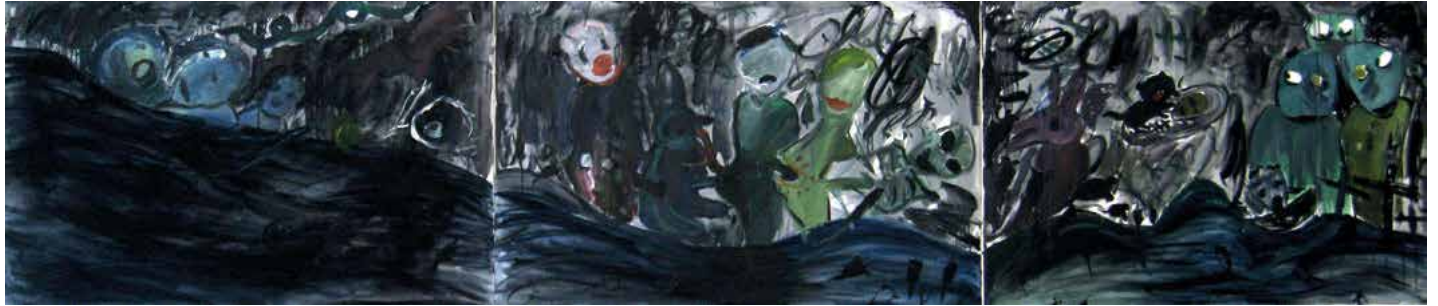
Dialog mit der Arbeit „Area 7“ 2006 von Christoph Schlingensiefel 和艺术家克里斯托夫施林根基夫作品“Area 7”的对话 Dialogue with the work “Area 7” 2006 by Christoph Schlingensiefel