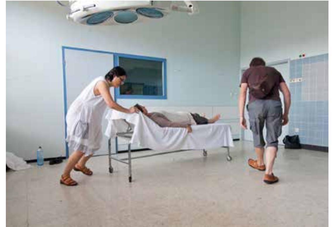
“Endstation St. Josef” in Königswinter, Deutschland, 2012 德国克尼格斯温特尔 “Endstation St. Josef 医院, 2012 “Endstation St. Josef” in Königswinter, , Germany, 2012