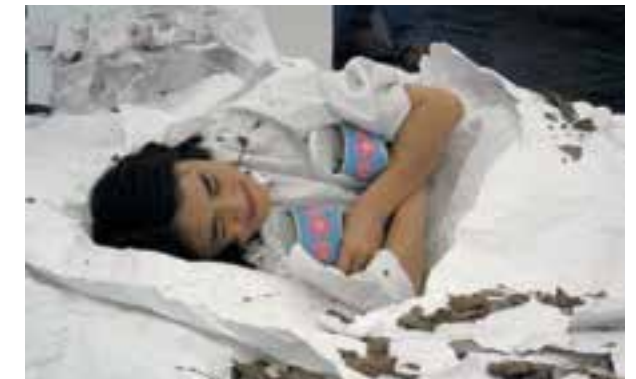
Abb.28 Relly Tarlo: Himmelsleiter, 2007 (oben) Yingmei Duan: Dream, 2007 (unten)