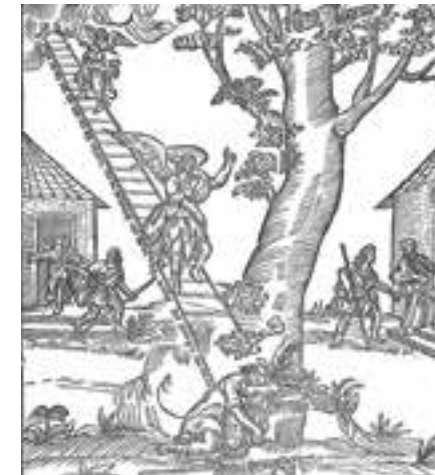
Abb.27 Hermann von der Hardt: Hermes Trismegistos, 1737

Archetypische Symbole inspirieren Yingmei. 2008 schläft sie während der Kunstmesse in Köln auf einem Bett, das sie zu Füßen der Installation des Künstlers Relly Tarlo aufgebaut hat. Tarlo hat eine Himmelsleiter konstruiert (Abb. 28). In ihrer Installation „HBK – My last lesson“ hat Yingmei 2006 als Meisterschülerarbeit 5000 selbst gefaltete Papierschiffchen auf dem Innenhof der HBK Braunschweig verstreut. Eine wehmütige Reminiszenz an ihre Sehnsucht nach dem Paradies, das sie für einige Jahre an der HBK gefunden hatte und das sie nunmehr auf unbestimmtem Weg mit unbekanntem Ziel verlässt.