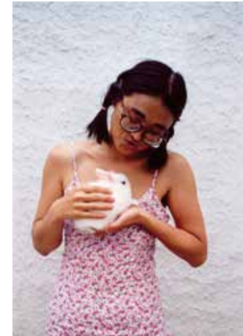
Abb.22 Yingmei Duan: Little secret, 2003