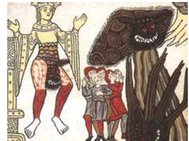
Abb.8 Hildegard von Bingen: Ecclesia und der Antichrist, 1141

In der Deutung des Geschlechtlichen trennen sich die Visionen Hildegards und Yingmeis allerdings sehr scharf, denn Yingmei begreift Sexualität völlig unbefangen. Sie betont mit der Fratze die tierischen Komponenten des Sexuellen, das sie unpathetisch und pragmatisch von der Liebe zu trennen weiß. In einer chinesischen Welt ohne