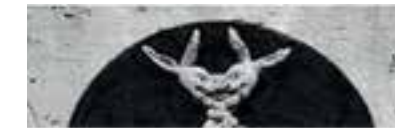
Die Fratze des Teufels als Vexierbild