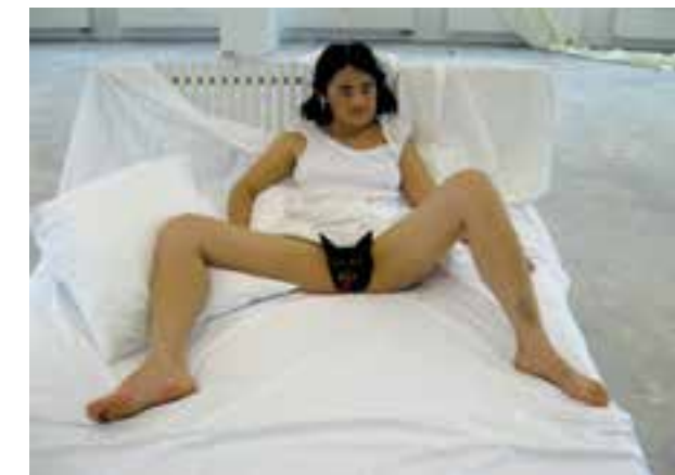
Abb.6 Yingmei Duan: Sleepless in Berlin, 2007

Für Hildegard wird alles, was unterhalb der Gürtellinie liegt, zum Angstbild. In goldener Schönheit erstrahlt ihre Vision der Ecclesia erst oberhalb der Gürtellinie, darunter ist sie nackt und zerschunden und stinkt zwischen den Beinen.