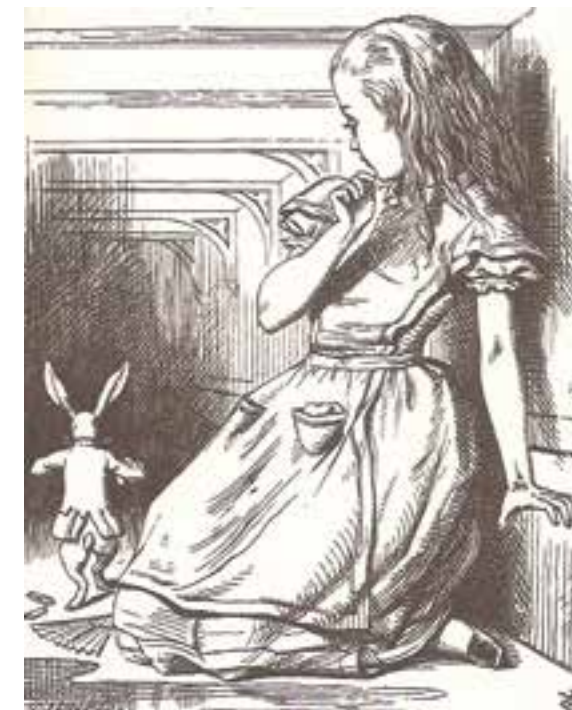
Abb.1 John Tenniel: Alice und das weiße Kaninchen

Die Phantasiewelt der Alice-Abenteuer wird von Tenniel auf die Ebene des Vorstellbaren und Glaubhaften projiziert, der Mädchentraum wird durch die Macht der Bilder geerdet. Dass diese Macht nicht übermächtig wird und den