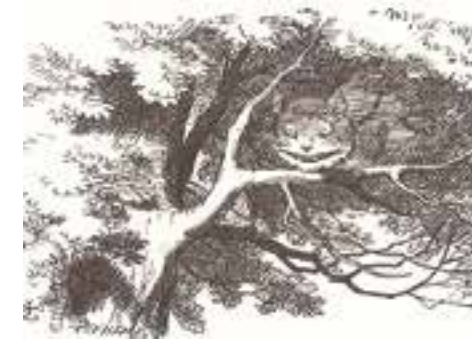
Abb.11 John Tenniel: Ein Grinsen ohne Katze