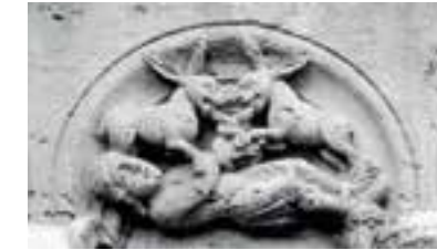
Zwei Hasen fesseln einen Jäger