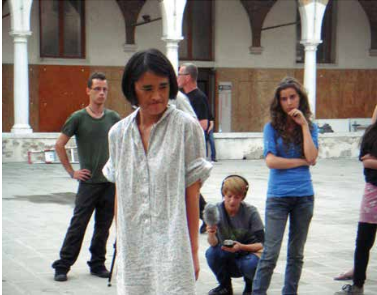
Infr'action Venedig, Italien, 2011 意大利威尼斯现场行为艺术节, 2011 Infr'action, Venice, Italy, 2011