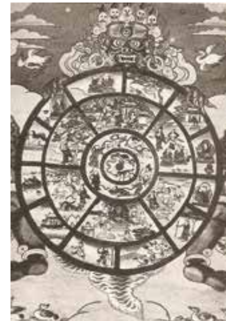
Abb.12 Tibetisches Weltrad.