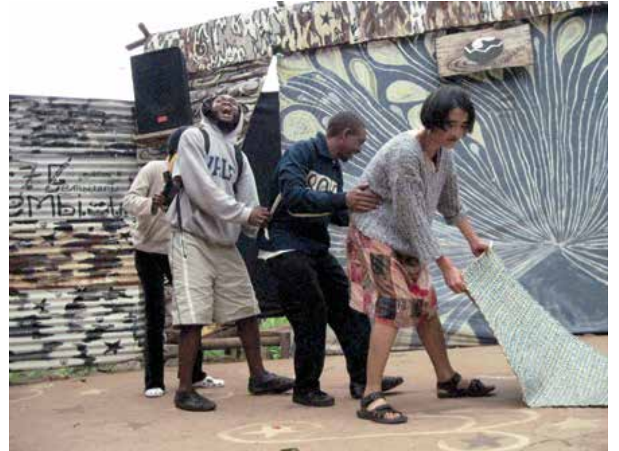
Swasiland, Afrika, 2010 非洲 斯威士兰, 2010 Swaziland, Africa, 2010