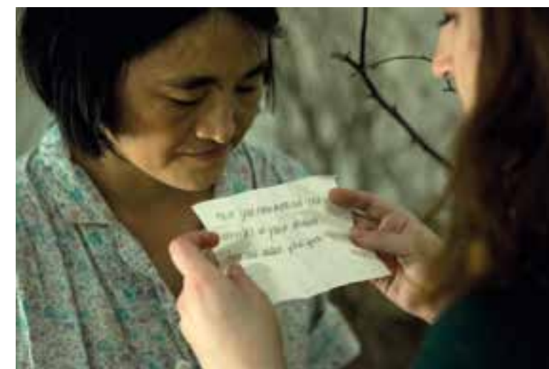
Hayward Gallery, London, Großbritannien, 2012 (3 Monate) 英国伦敦海沃德美术馆, 2012 (3个月) Hayward Gallery, London, UK, 2012 (3 months)