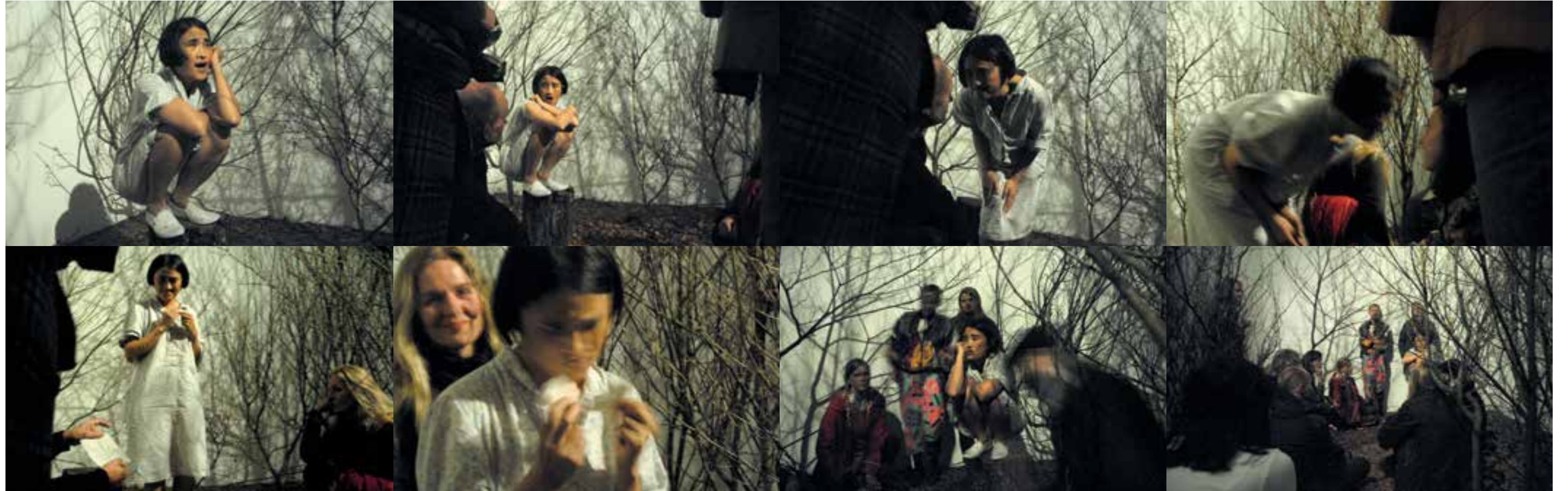
Lilith Performance Studio in Malmö, Schweden, 2008 (2 Tage) 瑞典马尔默莉莉丝行为艺术工作室, 2008 (2天) Lilith Performance Studio in Malmö, Sweden, 2008 (2 days)